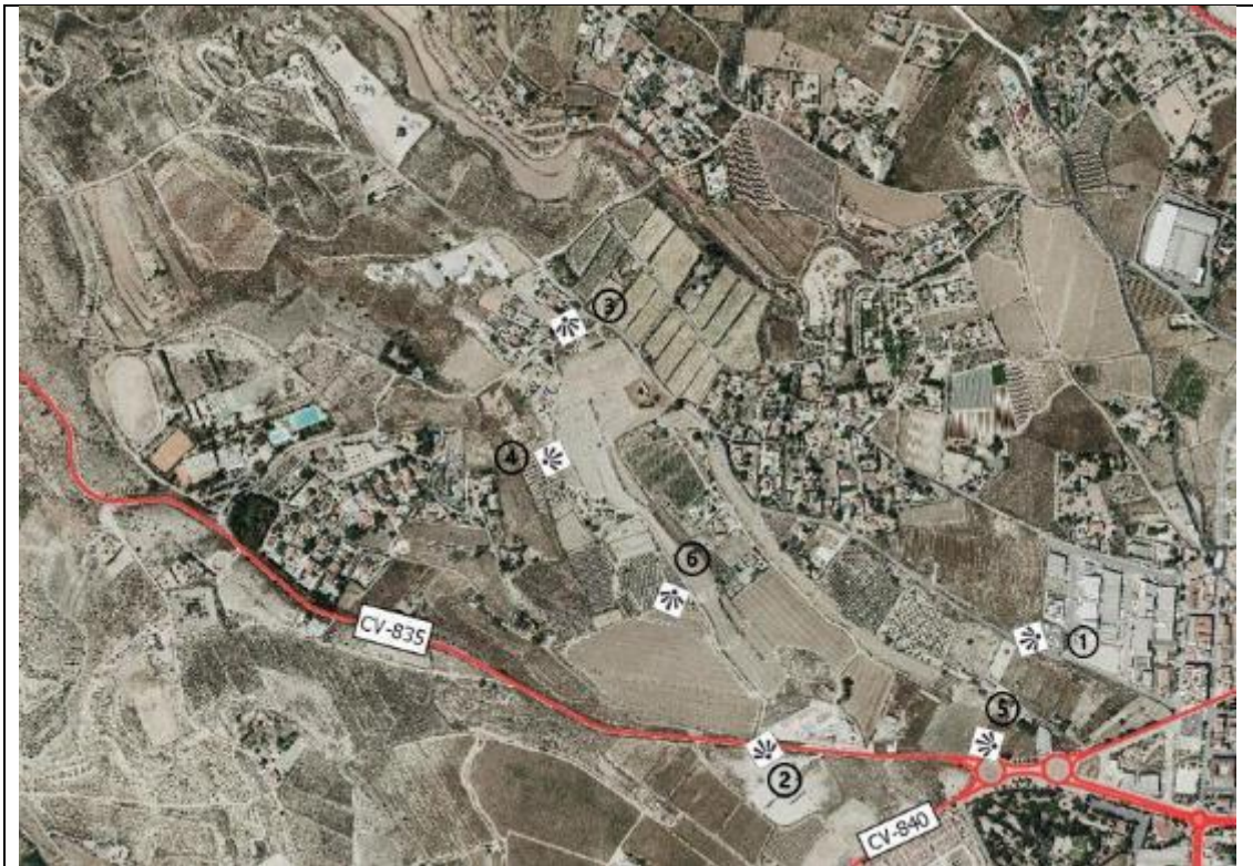
Localización de las fotografías