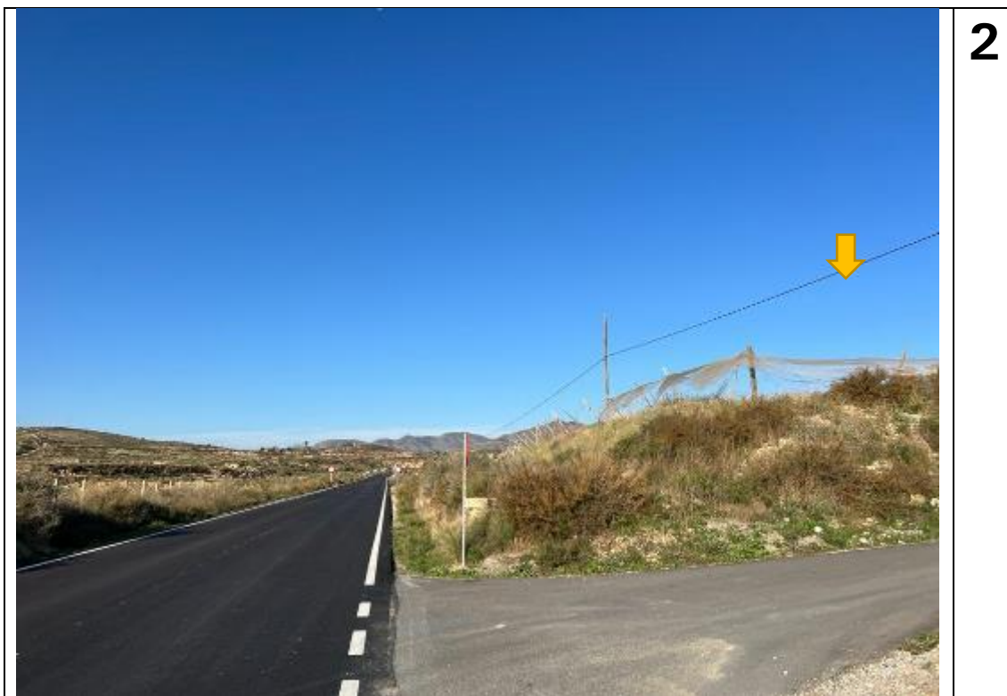
Imagen desde la carretera CV-835, cruce con el camino que dirige hacia la urbanización Cucuch. La parcela de implantación de la FV Manute no es visible para las personas ocupantes de los vehículos, debido a la orografía de la zona.

Abajo el fotomontaje con la plantación de cultivo de almendros ( Prunus dulcis ), que simula los patrones de paisaje agrario tradicionales de la zona en la visual desde la carretera.