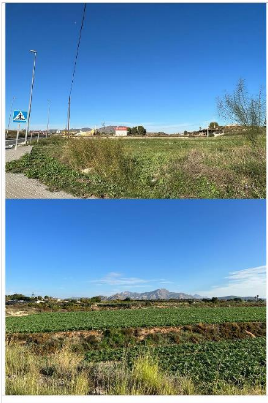
Participación Ciudadana - Preferencias Visuales