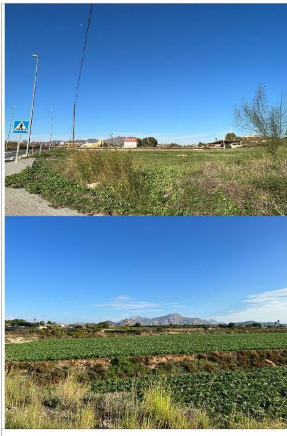
Participación Ciudadana • Preferencias Visuales