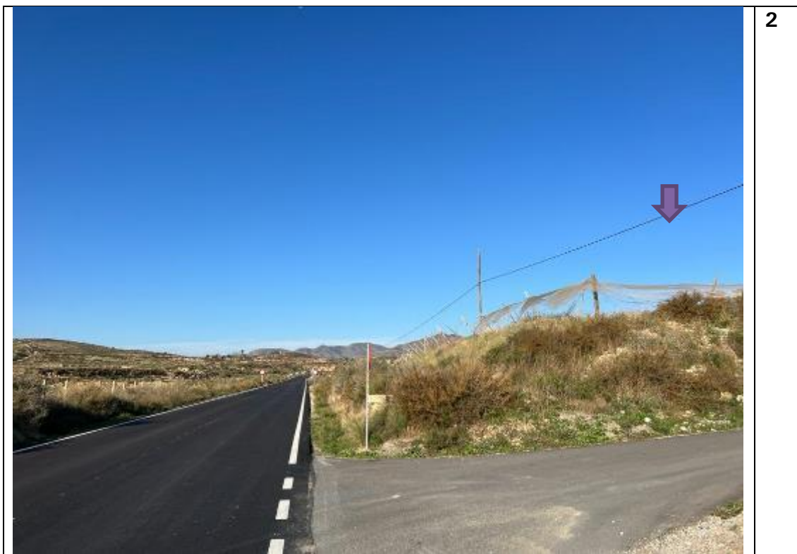
Imagen desde la carretera CV-835, cruce con el camino que dirige hacia la urbanización Cucuch. La parcela de implantación de la FV Manute no es visible para las personas ocupantes de los vehículos, debido a la orografía de la zona.

Abajo el fotomontaje con la plantación de cultivo de almendros ( Prunus dulcis ), que simula los patrones de paisaje agrario tradicionales de la zona en la visual desde la carretera.